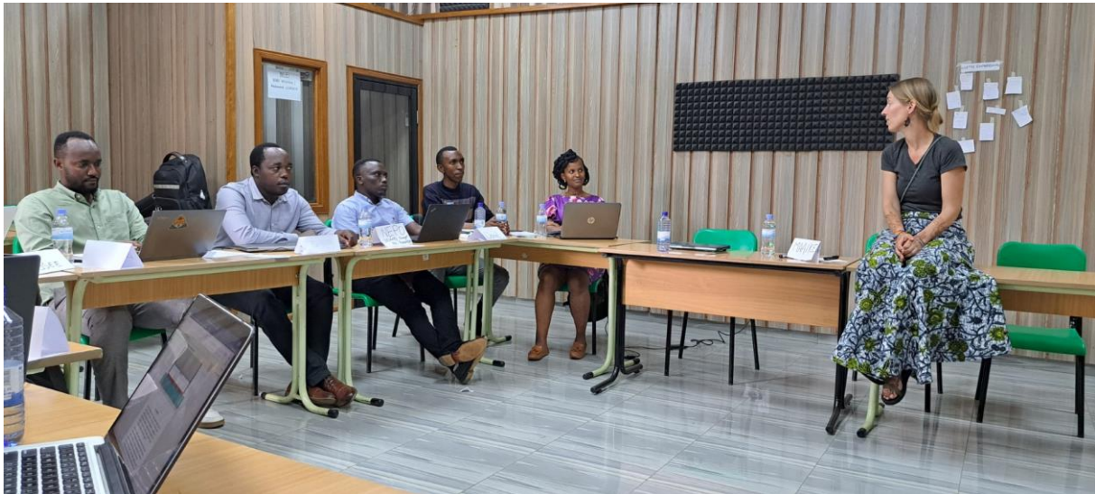
Augustus 2023 Teaching the Teachers